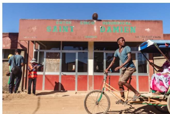
La même entrée en 2022