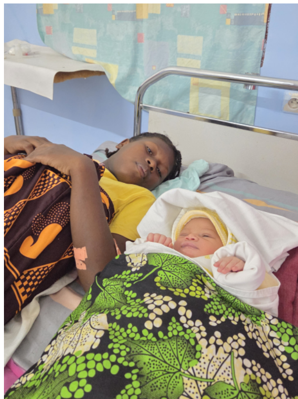
Une patiente et son bébé à l'unité de maternité

Madagascar, île magnifique, île pauvre, île confrontée à de nombreux défis ! Porter des projets dans ce pays