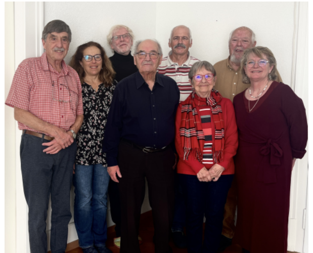
Das Komitee von Action Madagascar (Nov. 2025)

staatliche Hilfe für seinen Unterhalt aufkommen. Die Unterstützung der Stiftung «Action Madagascar» ist daher sowohl für den Betrieb des Krankenhauses als auch für die Finanzierung von Investitionen im Zusammenhang mit der medizinischen Versorgung der Bevölkerung ohne jegliche soziale Diskriminierung von entscheidender Bedeutung.