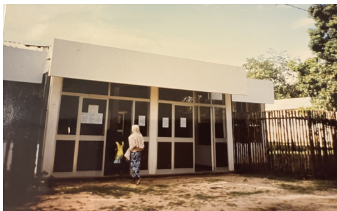
L'entrée du CMC St-Damien en 1988

Fin 1986, trois jeunes Fribourgeois rencontrent un ami capucin, le Père Souchon, qui les invite à passer leurs prochaines vacances à Ambanja, dans une léproserie. Cette expérience leur offre l'occasion de vivre concrètement leur foi et les marque profondément : ils y découvrent la pauvreté et les conditions de vie précaires des Malgaches de la région. De retour en Suisse, une question se pose très vite : comment trouver des fonds, du matériel et des ressources pour soutenir le dispensaire local ? L'idée de créer une fondation apparaît alors comme la solution. Le soutien est d'emblée considérable : des donateurs privés, des fondations, des entreprises ainsi que des sociétés chorales et musicales sont sollicités et s'engagent. La « Fondation Action Madagascar » est née.