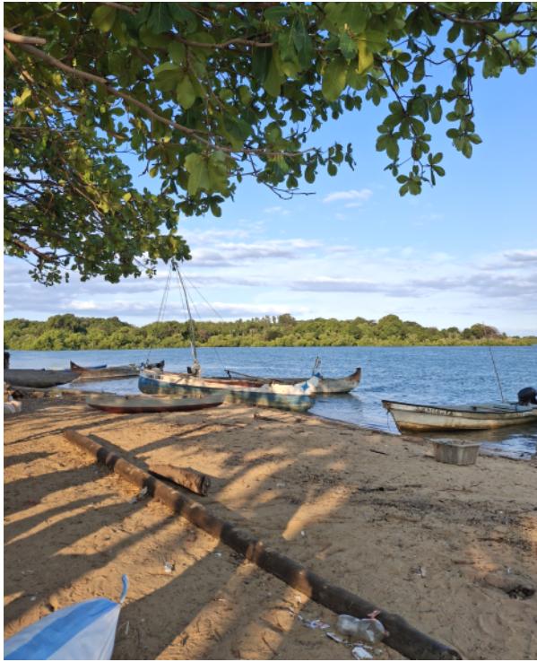
Nos pirogues pour partir en tournée à Nody Faly

pour nous faire découvrir la végétation et les ressources de l'île. Jéromine connaît beaucoup de monde sur Nosy Be et nous sommes donc toujours bien entourées lors des trajets entre l'aéroport et Ankify, ce qui est très rassurant, malgré les nombreuses sollicitations des locaux souhaitant nous aider à porter nos affaires.