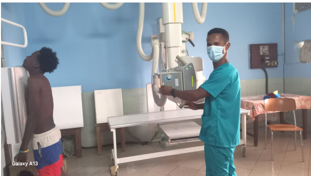
Le radiologue du CMC avec les nouveaux appareils livrés en 2025

L'année 2026 sera également importante pour le CMC.