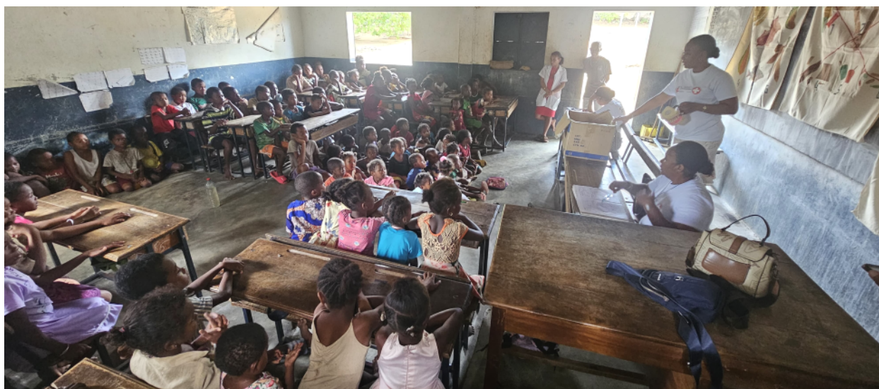
En tournée avec l'équipe médicale du CMC

l'état de santé des enfants est visible. Grâce au travail de la clinique et au soutien de la Fondation, ces actions changent réellement des vies.